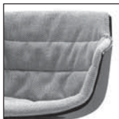
Flow Slim tapizada