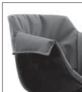
Flow Slim tapizada XL