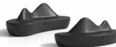
USB (2 units / unidades)

BACHMAN USB dual charger / Cargador USB doble 5V | 2,4A Input voltage / Tensión de entrada: 100-250V~/50-60 Hz 1 x USB-C 22W 1 x USB-A 18W