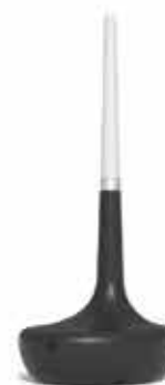
USB (1 unit / unidad)