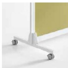
PATA DOBLE RUEDAS DOUBLE LEG WITH CASTORS PIED DOUBLE AVEC ROUES