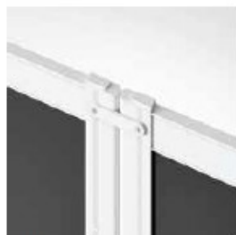
UNIÓN LINEA / 180° LINE CONNECTION 180° CONNEXION LIGNE 180°