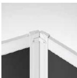
UNIÓN 120° (2 VÍAS) CONNECTION 120° (2 WAY) CONNEXION 120° (2 VOIES)