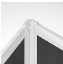
UNIÓN 90° (2 VÍAS) CONNECTION 90° (2 WAY) CONNEXION 90° (2 VOIES)