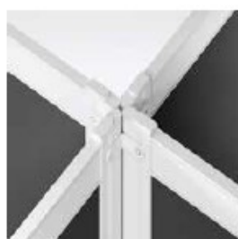
UNIÓN 90° (4 VÍAS) CONNECTION 90° (4 WAY) CONNEXION 90° (4 VOIES)