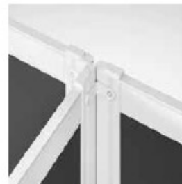
UNIÓN 90° (3 VÍAS) CONNECTION 90° (3 WAY) CONNEXION 90° (3 VOIES)