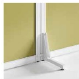
PATA INDIVIDUAL SINGLE LEG JAMBE UNIQUE