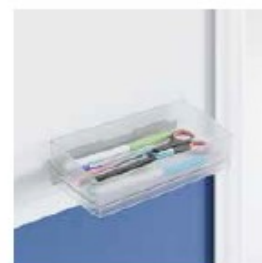
BANDEJA TRAY PLATEAU