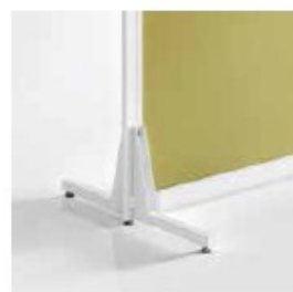
PATA DOBLE DOUBLE LEG PIED DOUBLE