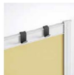
COLGADOR HANGER CINTRE