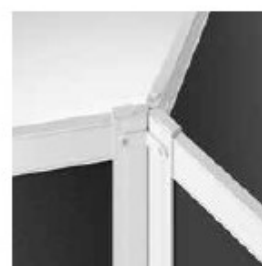
UNIÓN 120° (3 VÍAS) CONNECTION 120° (3 WAY) CONNEXION 120° (3 VOIES)