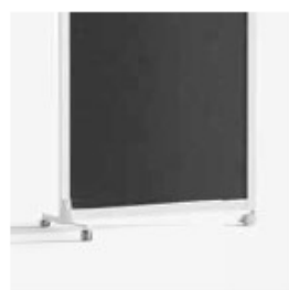
PATA DOBLE CON RUEDAS + RUEDA DOUBLE LEG WITH CASTORS + CASTOR DOUBLE PIÉD AVEC ROUES + ROUE